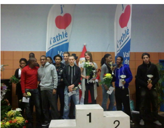
De futurs grands champions