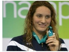
Camille Muffat Médaille d'Or 200m nage libre