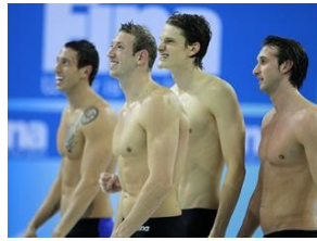
Une équipe motivée pour Shanghai cet été

Avec un total de 8 médailles, 3 en or, 3 en argent et 2 en bronze, les nageurs français se sont honorablement comportés au dernier championnat du monde en petit bassin à Dubaï.