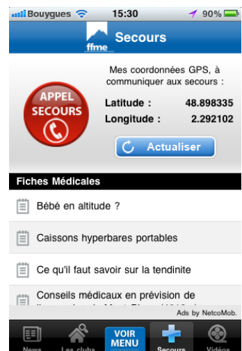
Onglet Secours avec les fiches médicales