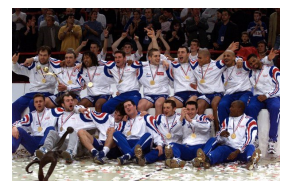
Les Costauds en 2001