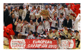
Or au Monde 2010