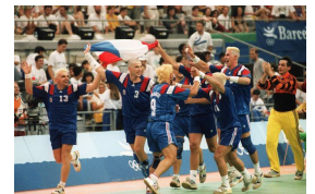
Les Bronzés en 1992