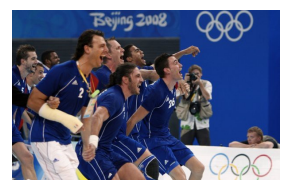
Les Experts en 2008