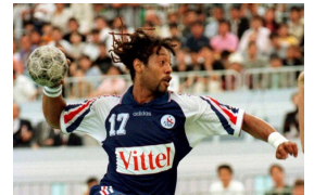
Les Barjots en 1997