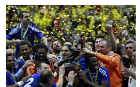
Or au Monde 2011