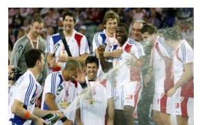
Or au Monde 2009