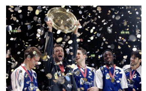
Or à l'Euro 2006