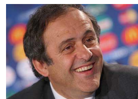
Michel PLATINI Président de l'UEFA

Rappelons que Michel Platini s'est exprimé pour une coupe du monde 2022 en hiver, tandis que Bin Hamman suggère de créer des « nuages » au dessus des stades pour y faire baisser la température.