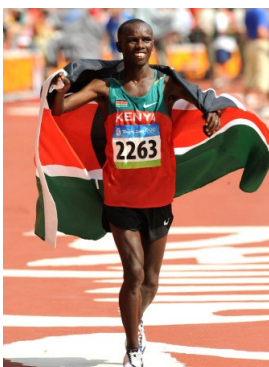
Samuel WANSIRU Médaille d'Or au JO de Pékin

La réputation des Kenyans dans les Marathons n'est plus à faire. En 2010, ils ont raflé 126 victoires sur 156 courses internationales, remportant ainsi la modique somme de 96 millions d'euros!