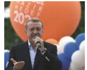
Recep Tayyip ERDOGAN

Le 1 er septembre est la date limite de dépôt des candidatures avant le choix définitif du 7 septembre 2013.