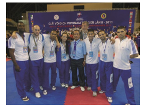
Equipe Seine et Marne