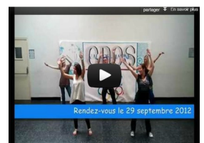
Chorégraphie Flash Mob