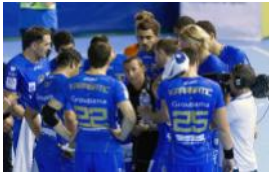
Club de Montpellier

Une actualité qui ternit l'image du sport en général, qui est reprise par les médias nationaux et complique la tâche quotidienne des infatigables éducateurs bénévoles.