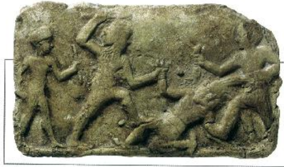
Gilgamesh au combat (III ème millénaire avant J.C.)

...partout sur terre et dans le même ordre, pour toutes les populations, le développement - spirituel et social - suivant voit le jour :