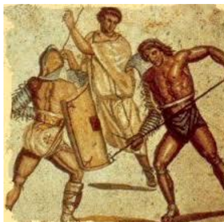
Gladiateurs à Rome, République et Empire

Dans cet immense aller – retour géographique et temporel, l'émergence des principales techniques martiales voit le jour, et celles-ci vont finir par s'implanter définitivement (non sans continuer à évoluer) et par prendre et revêtir leurs caractéristiques culturelles et identitaires propres.