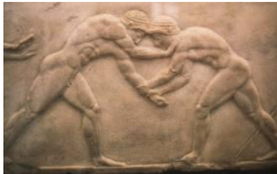
Lutteurs grecs (1er millénaire avant J.C.)

A l'ouest, les échanges entre les peuples de la mer Méditerranée (Phéniciens, Egyptiens, Minoens et Grecs) donnent naissance à de nombreuses pratiques de combat armés et non armés, dont les plus illustres, vont devenir et rester : le pugilat ou boxe (actuelle boxe anglaise), la lutte (actuelle lutte libre ou Gréco-Romaine) et le pancrace (actuel M.M.A., Free Fight, Pancrace ou encore Vale Tudo). Ces 3 disciplines, inscrites au programme des Jeux Olympiques antiques (fondation en – 776 avant J.C.), voyageront avec les grecs en Asie Mineure lors de l'expédition des « 10 000 » dont Xénophon a laissé la trace, et surtout avec l'extraordinaire épopée d'Alexandre le Grand, conquérant Macédonien. Ce voyage, teinté à la fois d'élan culturel, de motivation politique, d'impérialisme et de sauvagerie permettra à son tour à une armée professionnelle où tous s'entraînent à la guerre et au combat, et dont beaucoup ont participé aux Jeux Olympiques antiques, de répandre ces techniques martiales et toute la culture qui les accompagnent.